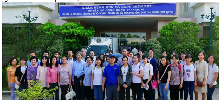
Chương trình khám bệnh và phát thuốc từ thiện bệnh hen và COPD tại huyện Gò Công Đông năm 2016

Cho đến tháng 01/2019, Hội đã xây dựng được 184 đơn vị ACOCU trên khắp cả nước. Bên cạnh đó, trong năm 2018, Hội đã có thêm một thành quả tích cực rất đáng được ghi nhận khi đạt được thỏa thuận ký kết giữ Hội Hen – Dị ứng – Miễn dịch lâm sàng TP.HCM, Hội Hô hấp Việt Nam, Hội Phổi Việt Nam và Cục Quản lý Khám, chữa bệnh Bộ Y tế với công ty dược phẩm AstraZeneca trong việc triển khai chương trình “Vi Lá Phổi Khỏe (Healthy Lung)” giai đoạn 2018 – 2020 với mục tiêu phát triển 150 phòng quản lý ngoại trú Hen và COPD với cơ sở hạ tầng đạt chuẩn trên cả nước, cũng có góp phần việc chẩn đoán sớm, điều trị hiệu quả, nâng cao chất lượng quản lý bệnh hen và COPD.