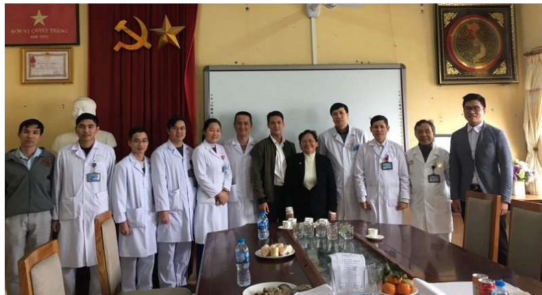
Thành lập đơn vị ACOCU tại Học Viện Quân Y 103