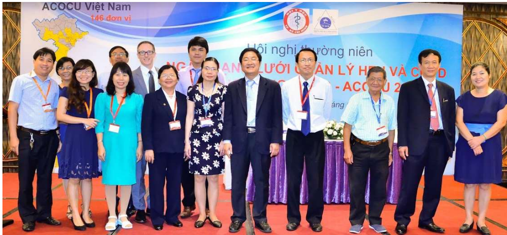
Hội nghị thường niên – Ngày mạng lưới quản lý Hen & COPD trong cộng đồng năm 2017