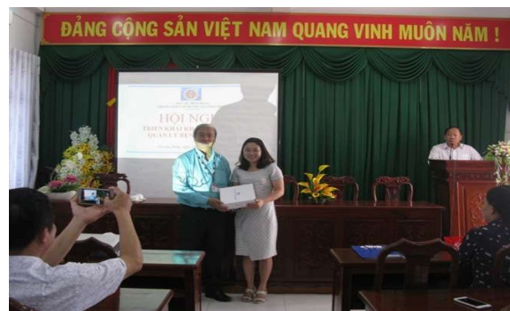
Khám tầm soát hen & COPD tại TTYT thị xã Bình Long, Bình Phước và Trao tặng máy hô hấp ký tại TTYT huyện Gò Công đông, Tiền Giang năm 2018