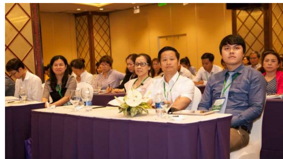
Hội nghị khoa học thường niên lần V, năm 2018