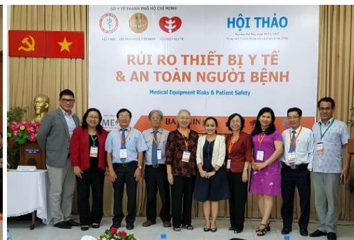
Hội thảo: "Rủi ro từ thiết bị y tế và an toàn người bệnh 2018"