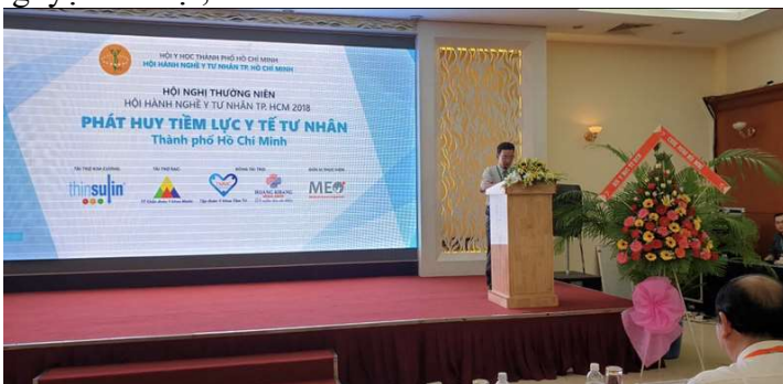
Hội nghị thường niên Hội Hành Nghề Y Tự Nhân TP.HCM 2018 phát huy tiềm lực y tế tư nhân TP.HCM

Gia tăng kết nạp hội viên, hội hành nghề ít nhất 100 hội viên/năm.