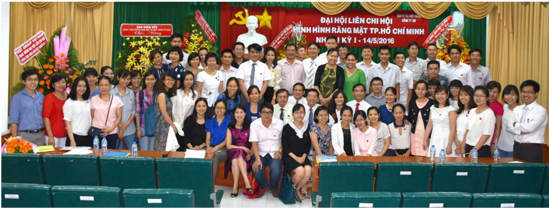
Đại hội thành lập Liên chi hội Chính hình Răng Mặt TP.HCM.