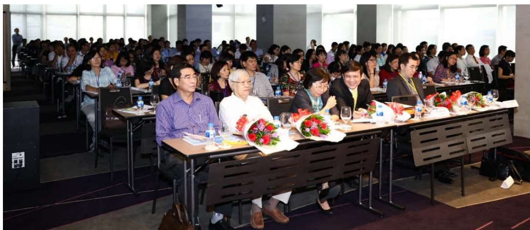
Hội nghị lần I của Hội CHRM TP.HCM ngày 4/12/2016