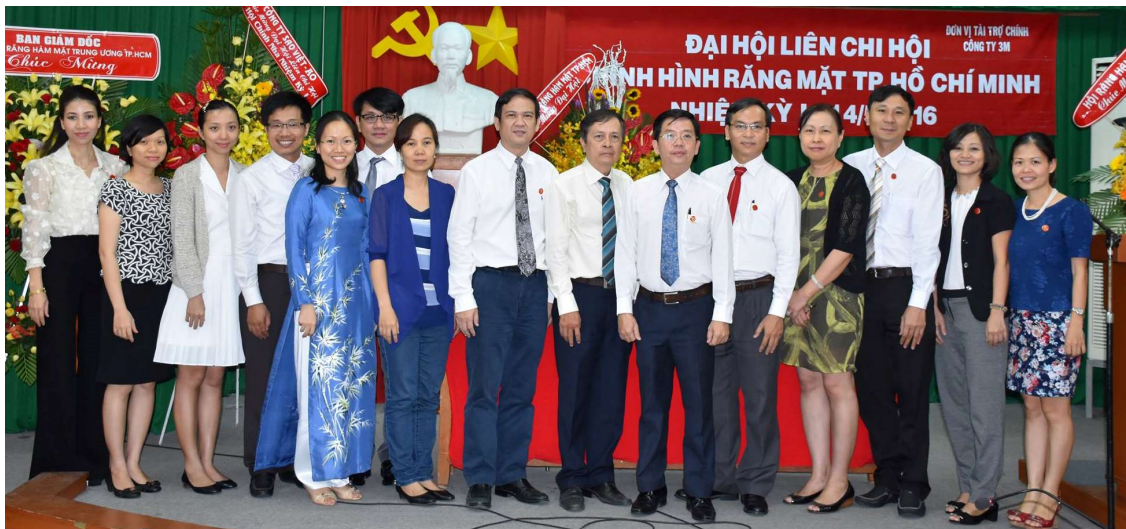
Ban Chấp hành Hội CHRМ nhiệm kỳ I