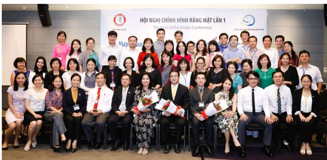
Hội nghị lần I của Hội CHRM TP.HCM ngày 4/12/2016 tại khách sạn Liberty Central với đại diện của Hội Y học TP.HCM và Hội Răng Hàm Mật TP.HCM cùng 200 hội thảo viên