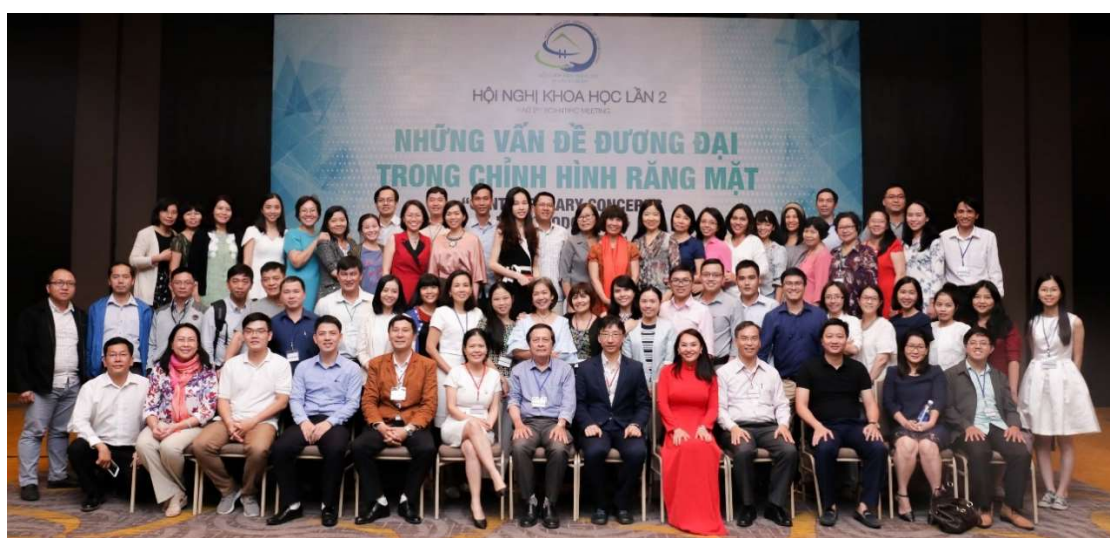
Hội nghị lần II của Hội CHRM TP.HCM ngày 16-18/12/2018 tại khách sạn Sheraton với 300 hội thảo viên