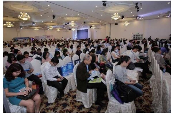
Hội nghị thường niên 2018 tại Cần Thơ