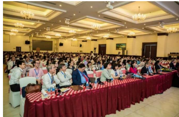
Hội nghị thường niên 2019 tại Phan Thiết