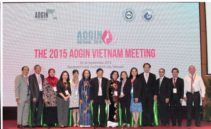
Hội nghị quốc tế AOGIN