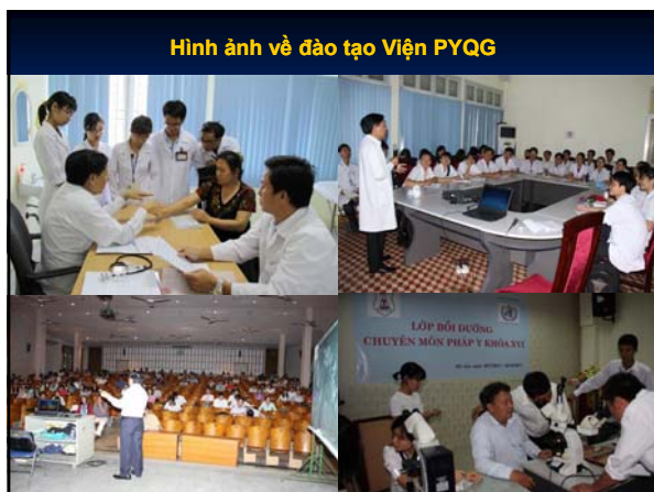
Hình ảnh về đào tạo Viện PYQG