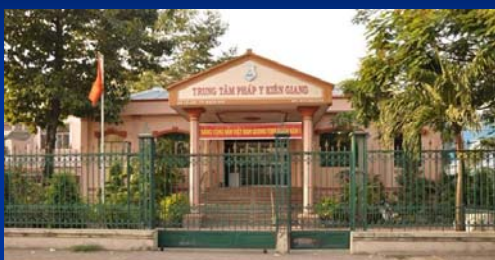
Trung tâm Pháp y tỉnh Kiên Giang