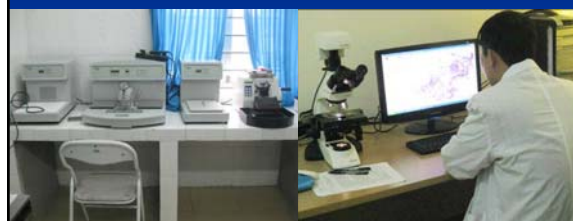
Trang thiết bị ở pháp y địa phương