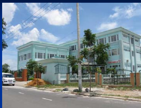
Trung tâm Pháp y Đà Nẵng