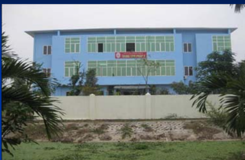
Trung tâm Pháp y Vĩnh Phúc